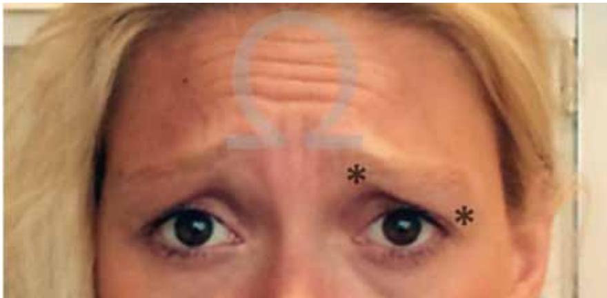
Abb. 3. Omega melancholicum und Veraguth-Falte (*)

Botulinumtoxin hat in den vergangenen knapp 200 Jahren in der Medizin eine beachtliche Entwicklung genommen. Zunächst gefürchtet als Auslöser mitunter tödlich verlaufender Vergiftungen, hat es aufgrund seiner paralyisierenden Eigenschaften in der Behandlung von Erkrankungen, die mit einem erhöhten Muskeltonus einhergehen, einen festen Platz eingenommen. Vergleichbar mit vielen heute in der Medizin angewandten Wirkstoffen (z.B. das 1928 durch den schottischen Bakteriologen Alexander Fleming entdeckte Penicillin) geht die Entdeckung seines Nutzens auf glückliche Zufälle und aufmerksame Forscher zurück. Trotz seiner enormen