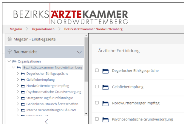
Lernplattform „Digitaler Weiterbildungscampus“