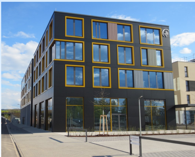
Das neue Kammergebäude in der Zimmerstraße